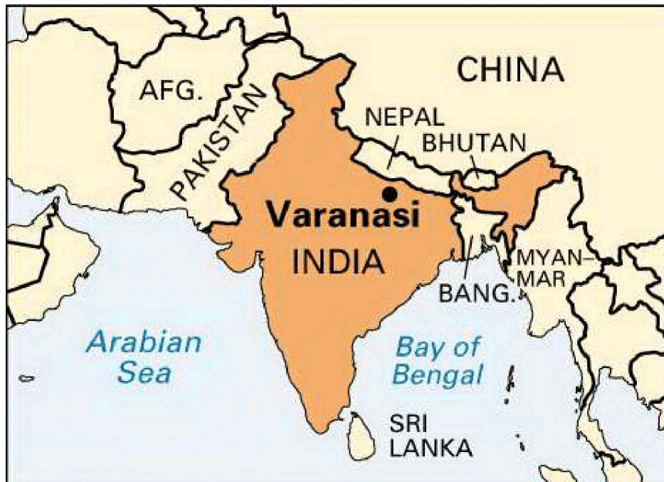
Bản đồ nơi Đức Phật giảng ba bài pháp đầu tiên