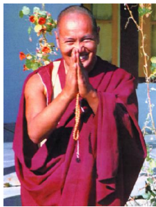
Lạt Ma Yeshe

Tiểu sử ngài đã được nói trong cuốn Dẫn nhập vào Năng lực Trí tuệ, một loạt bài chọn lọc từ những buổi giảng nhân dịp ngài viếng thăm Bắc Mỹ cùng với Lama Thubten Zopa Rinpoche. Ở đây chỉ xin nhắc lại vài điểm vắn tắt. Lama Yeshe ra đời ở Tolung gần Lhasa vào năm 1935, sáu tuổi đã vào tu viện Sera, ở đây ngài được hấp thụ một nền giáo dục rộng rãi về thế học và Phật học. Sau khi Tây tạng bị chiếm năm 1959, ngài hoàn tất việc học ở trại tị nạn Buxaduar đông nam Ấn, và đi định cư gần tháp Boudhanath, ngoại biên Kathmandu, Nepal. Ở đây ngài khởi sự tiếp xúc nhiều người Tây phương. Năm 1971 ngài cùng Lama Zopa sáng lập trung tâm Tu viện Đại thừa trên đỉnh đồi Kopan, tổ chức những khóa giảng hàng năm lôi cuốn học viên ngày càng đông. Những học viên này về sau đã mở thêm hơn ba mươi trung tâm tu học. Trong mười năm cuối đời, Lama Yeshe thường lui tới những trung tâm này để diễn giảng, tổ chức các khóa huấn luyện lãnh đạo, và quan trọng hơn cả, gây cảm hứng cho mọi người, làm tấm gương thân giáo về hạnh lợi tha không mỗi mảy. Cuối cùng, vào ngày 3 tháng 3 năm 1984, tại bệnh viện Cedars-Sinai ở Los-Angeles, vào sáng sớm đầu năm âm lịch, ngài viên tịch vì chứng suy tim trầm trọng đã trên 12 năm đe dọa mạng sống ngài.