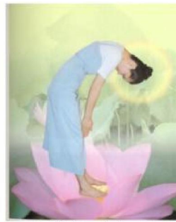
Thả lỏng hai vai