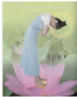
Cúi đầu & khom mình