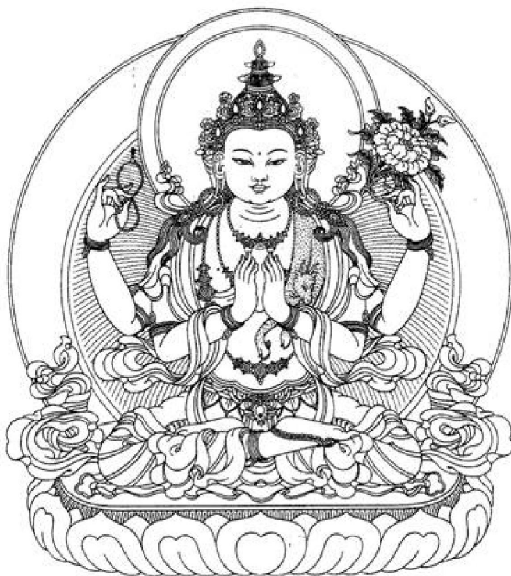
Figure 4. Avalokiteshvara, the Buddha of Compassion. Drawing by Robert Beer.