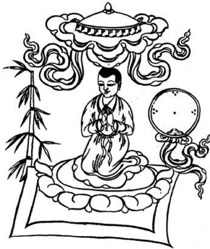
Hình Nộm của người Chết.

Trong nghi lễ chết, ý thức của người chết được triệu hồi vào hình nộm và yêu cầu ở tại đó để nhận giáo lý. Chỗ đứng của hình ảnh thu hút thân người chết, chú thích tên người chết cho ngữ của họ; một gương trong sáng cho tâm; y phục sạch cho quần áo; cái lọng cho nơi cư trú; đệm màu trắng cho chỗ ngồi; và gậy tre cho người chết cầm. Chú thích tên sau đây (khoảng trống được thay bằng tên người chết) sẽ xuất hiện dưới khoảng trống của hình; Cầu mong tâm thức đã chết của _____ được đặt ở đây. NRI DZA HUM BAM HO TISTANTU!